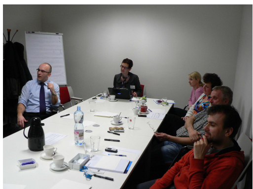
účastníci seminářů diskutují nad problémy nových zaměstnanců

Tvorba konceptu adaptačního procesu byla založena především na spolupráci se samotnými zaměstnanci, kteří se zpravidla dostanou do styku s novým zaměstnancem ihned při jeho nástupu do společnosti. Mohli tak při diskusních seminářích sdělit své zkušenosti z oblasti práce s novými zaměstnanci. Vzájemná výměna názorů mnohdy strhla zaměstnance k nekončícím diskusím, ze kterých vznikly rozsáhlé podklady pro vytvoření ucelené koncepce.